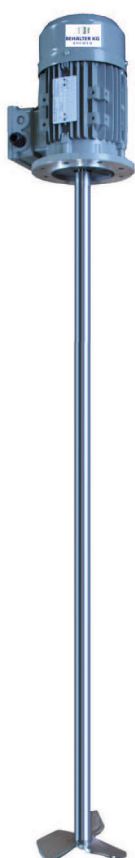
Frequenzumrichter zur Stufenlosen Drehzahlregelung.