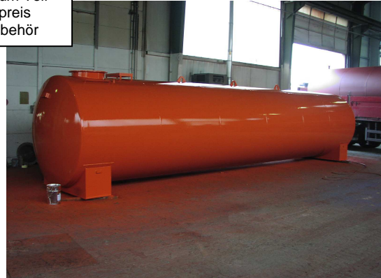
DIN 6616 für oberirdische Lagerung, außen auf unbehandelter Fläche grundiert