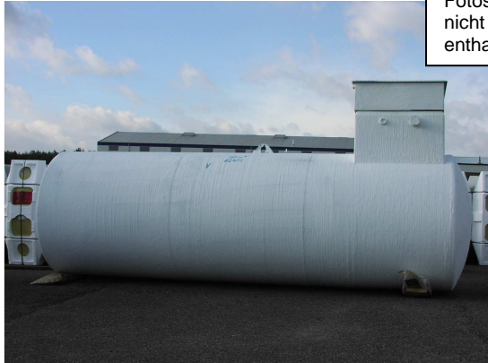
DIN 6608 für unterirdische Lagerung, außen bitumenisoliert

Fotos zeigen zum Teil nicht im Grundpreis enthaltenes Zubehör