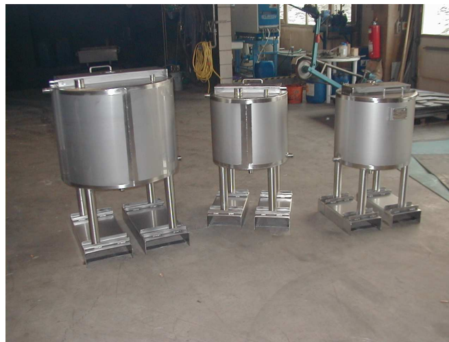
Sonderausführung auf Anfrage