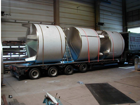
Behälter außen mit Schutzfolie beklebt