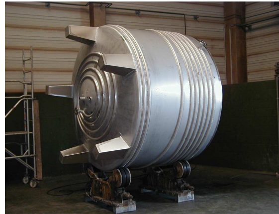
Zusatz : Halbrohrschlangen und seitlicher Rührwerksflansch